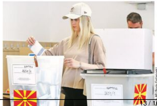
Гласање у Скопљу за председника државе и Собрание

Гордана Силановска Давкова и владајућег СДСМ председник Северне Македоније Стево Пендаровски, подсећа Танјуг. Да би Северна Македонија добила председника, излазност мора бити најмање 40 одсто од укупног броја уписаних бирача. На парламентарним изборима учествује 17 изборних листа. Пендаровски је, преноси Бета, јуче изјавио да има неповерљивих информација о томе да је на неким биралиштима било покушаја организованог бојкота другог круга председничких избора.