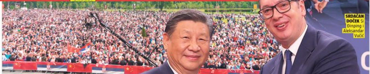
SRDAČAN DOČEK Si Dinping i Aleksandar Vučić

Број 3669 / 40 динара / Република Српска 1 KM / Црна Гора 0,7 EUR