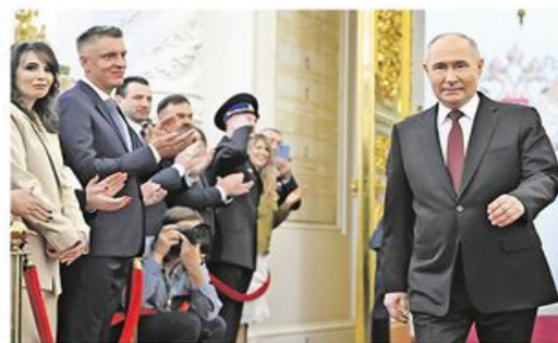
Свечаност у Великој палати Кремља

Владимир Путин јуче је званично започео пети мандат на положају председника Руске Федерације након полагања заклетве у Великој палати Кремља. Он ће на функцији остати наредних шест година, до 2030. године, преноси РИА Новости. Путин је на председничким изборима у Русији, одржаним од 15. до 17. марта, освојио 87,28 одсто гласова.