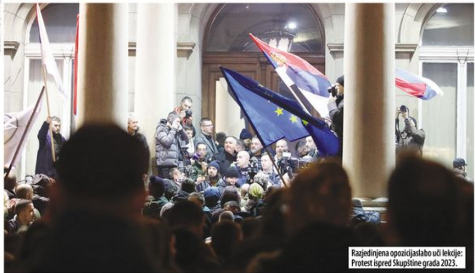
Razjedinjena opozicijaslabo uči lekcije: Protest ispred Skupštine grada 2023.

Tri nedelje do lokalnih izbora, praznici i neradni dani omeli početak aktivnosti stranaka koje ne podržavaju vlast