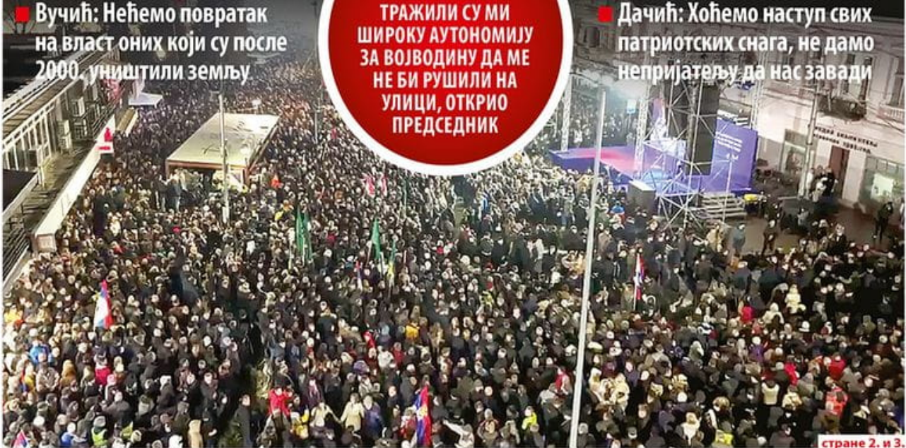
странице 2. и 3.

■ Дачић: Хоћемо наступ свих патриотских снага, не дамо непријатељу да нас завади