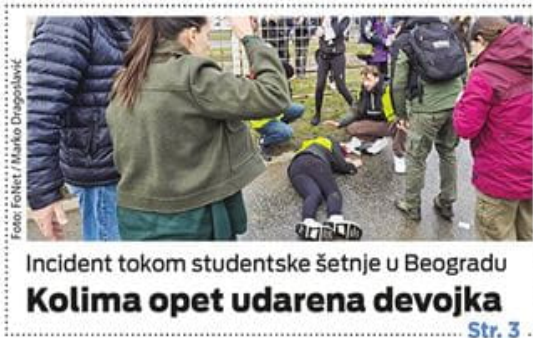
Incident tokom studentske šetnje u Beogradu Kolima opet udarena devojka Str. 3