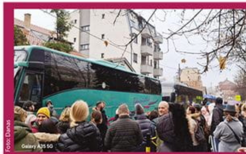
Voždovčani zaustavili autobuse za naprednjački miting u Jagodini Sedam prevoznika bilo u „blokadu“ Str. 7