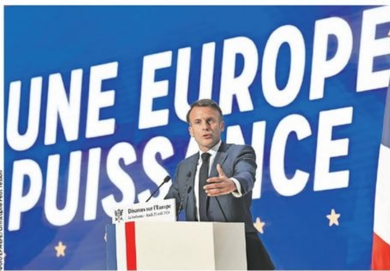
Медијски садржаји које гледају деца и адолесценти у ЕУ све више су „амерички и азијски“: француски председник

Русији се не сме дозволити да победи у Украјини, морамо да изградимо стратешки концепт кредибилне одбране