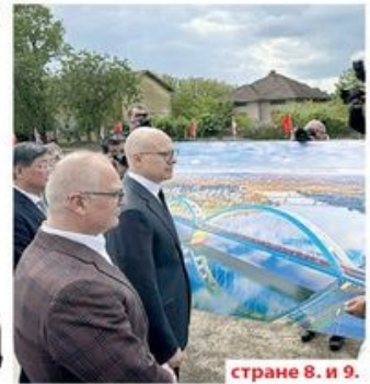
странице 8. и 9.

СПОЈЕНИ КОЛОСЕЦИ НА БРЗОЈ ПРУЗИ Од Београда до Суботице возићемо се за 80 минута