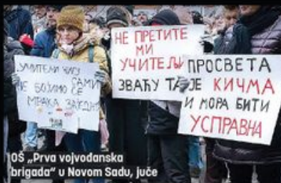
10Š „Prva vojvodanska brigada“ u Novom Sadu, juče