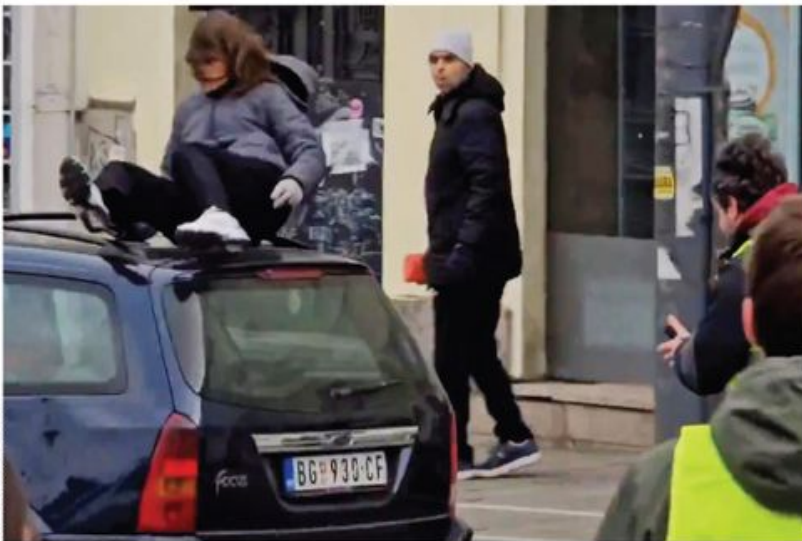
Studenti e bikkadi