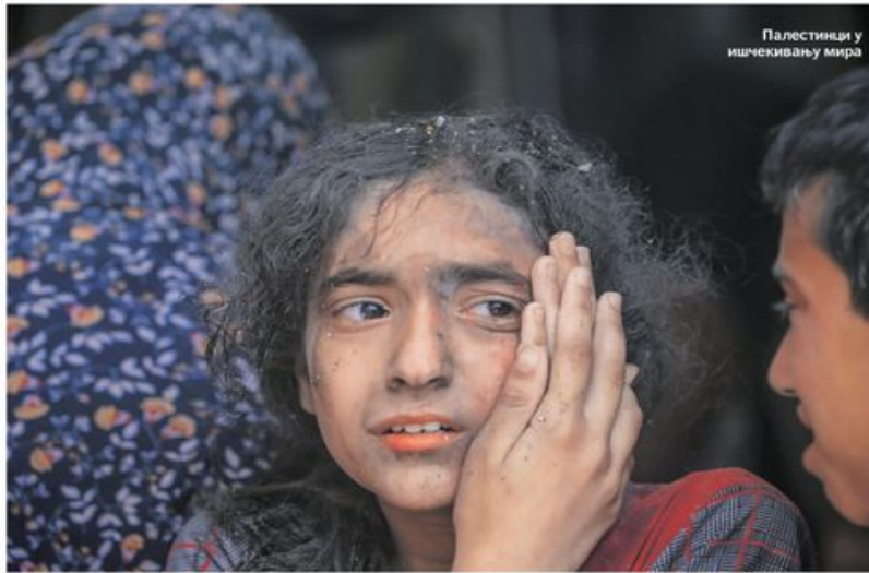
Палестинци у ишчекивању мира