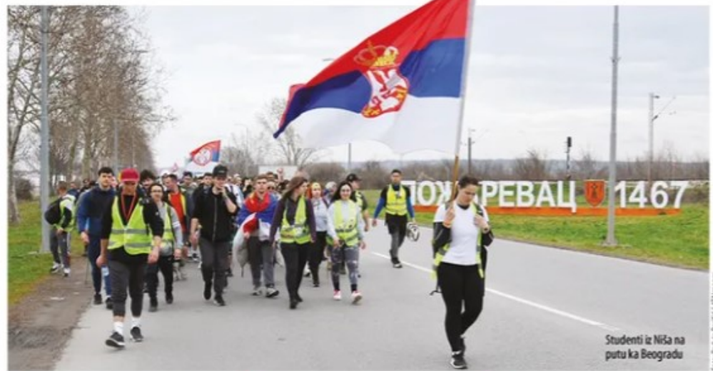
Studenti iz Niša na putu ka Beogradu