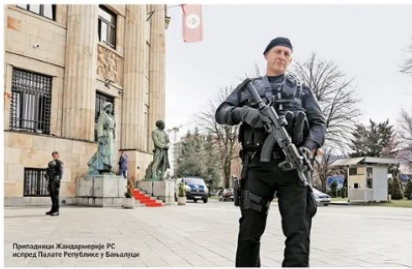
Припадници Жандармерије РС испред Палате Републике у Бањалуци

У Сарајеву воде истрагу против руководства РС због напада на уставни поредак, у Српској тврде да нико неће бити ухапшен