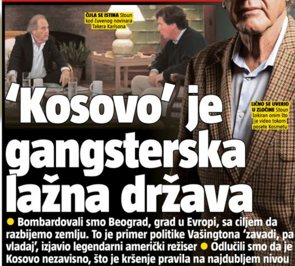
ČULA SE ISTINA Stoun kod čuvenog novinara Takeru Karlsona