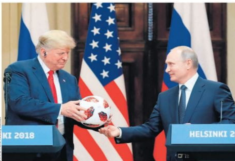
Сусрет Доналда Трампа и Владимира Путина у Хелсинкију, јул 2018. године