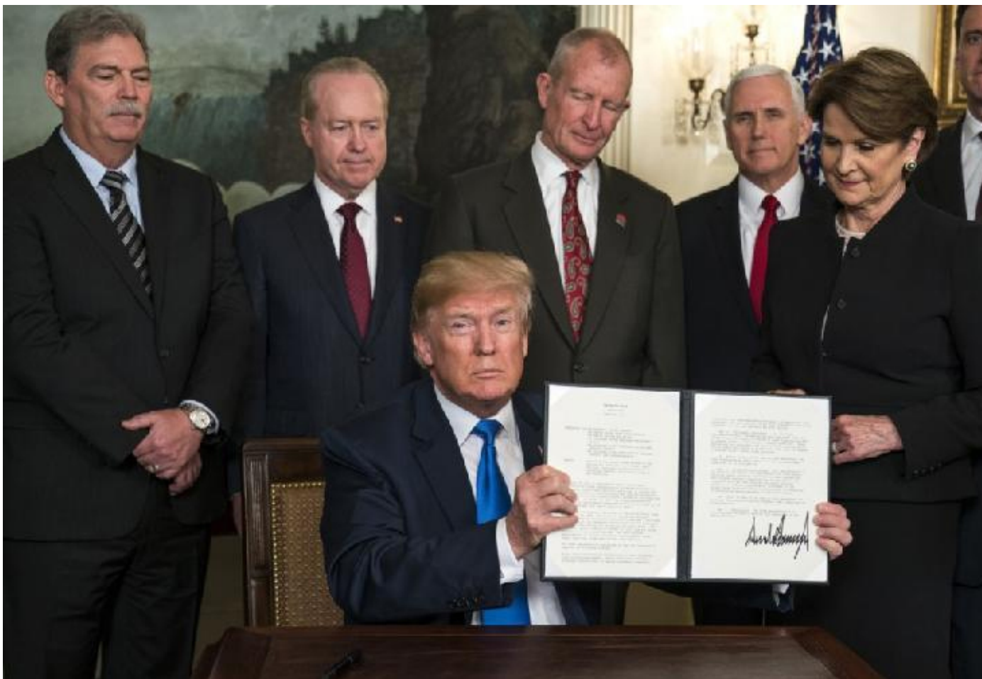
Председник САД Доналд Трамп са потписаним указом о подизању америчких царина

Термин „геоекономија“ – односно коришћење економске моћи од стране држава у циљу остваривања њихових геополитичких и економских циљева – ушао је на велика врата у дискурс данашњице. Истина, употреба економских инструмената за придобијање дипломатских савезника, кажњавање противника и форсирање оних између да бирају страну није нова пракса на кугли земаљској, али интензитет њене употребе јесте. Едвард Лутвак, кога многи сматрају оцем геоекономије, иако је већ 1990. тврдио да је након Хладног рата важност војне моћи уступила место геоекономској моћи, вероватно није ни слутио колико ће бити у праву.