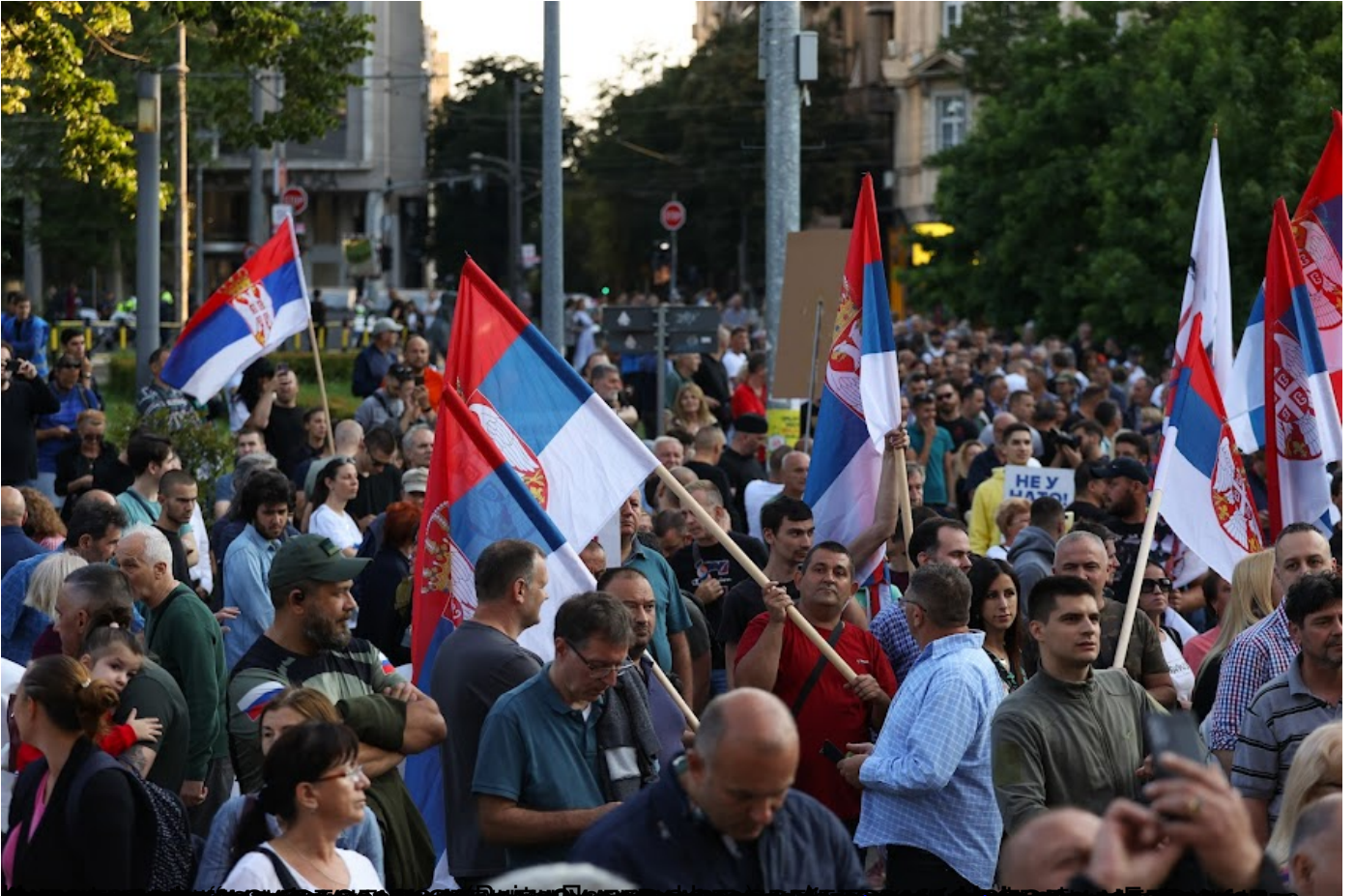
Митинг подршке Српској војсци на Видовдану. Београд, 29. јуна 2023.

Пише: Ђорђе Вукадиновић четвртак, 29 јун 2023 13:02